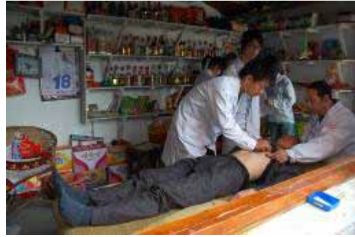
隣の売店も借りて