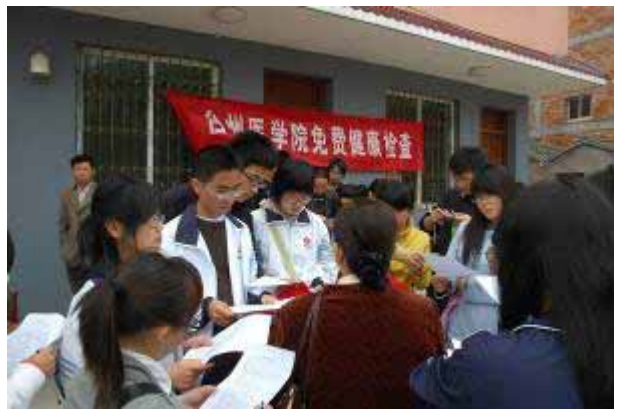
アンケート調査の説明