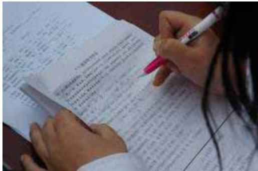
健康検査結果の記入