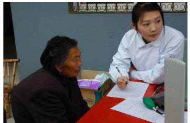
最初に健康検査を受けた村民