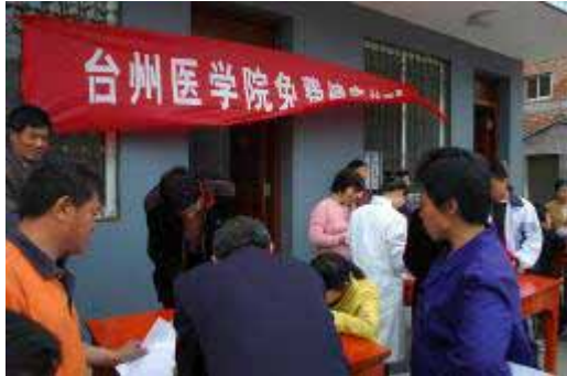
並んで順番を待つ村民