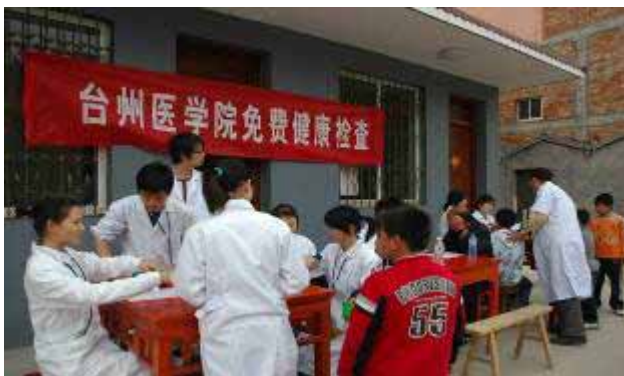
病院の先生たちの準備