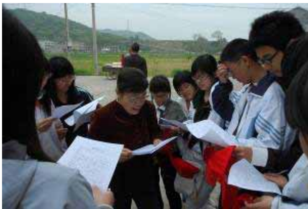
アンケート調査の説明